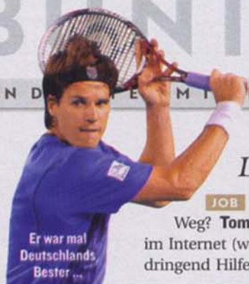
Er war mal Deutschlands Bester ...

THEMEN, TRENDS, TRENDS, TRENDS - DIE IN- UND OUT-LISTE