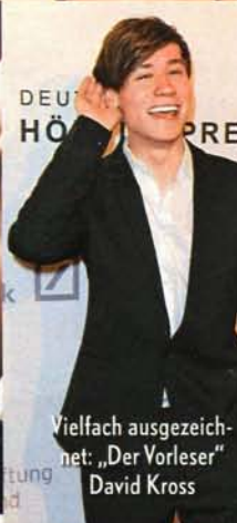
Vielfach ausgezeichnet: „Der Vorleser“ David Kross